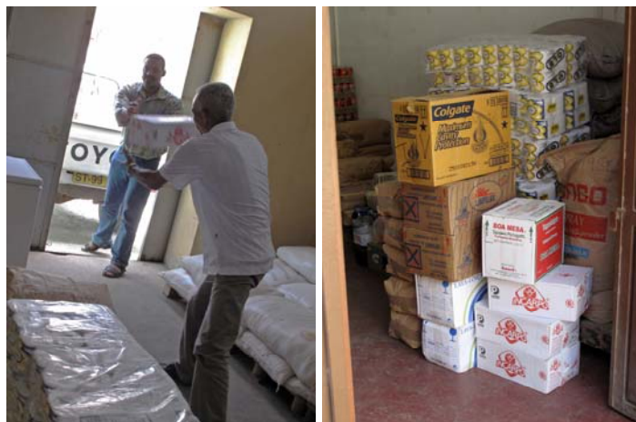
Stockage de nourriture dans le magasin général // São N.

Conjointement avec la délégation du ministère de l'éducation de São Nicolau nous avons décidé de stocker l'intégralité de la nourriture dans le magasin général . Ainsi la nourriture est distribuée régulièrement par la délégation scolaire dans toutes les écoles les plus nécessiteuses de l'île. La sélection des écoles bénéficiant des aides a été établie avec les éléments que nous avons pu recevoir des responsables ministériels. Cette nouvelle méthode de distribution permet au responsable du magasin de préparer la quantité exacte de nourriture en fonction du nombre d'élèves de l'école à livrer. Chaque sortie magasin fait l'objet de la rédaction d'une fiche pour l'association Regarde ailleurs . Ainsi nous pouvons contrôler les quantités de nourriture qui sortent de notre partie de magasin. De plus, cette méthode à l'avantage d'éviter les vols dans les écoles et les gaspillages. Cette méthode de gestion donnant de bons résultats en 2009 sera reconduite pour les prochaines années.