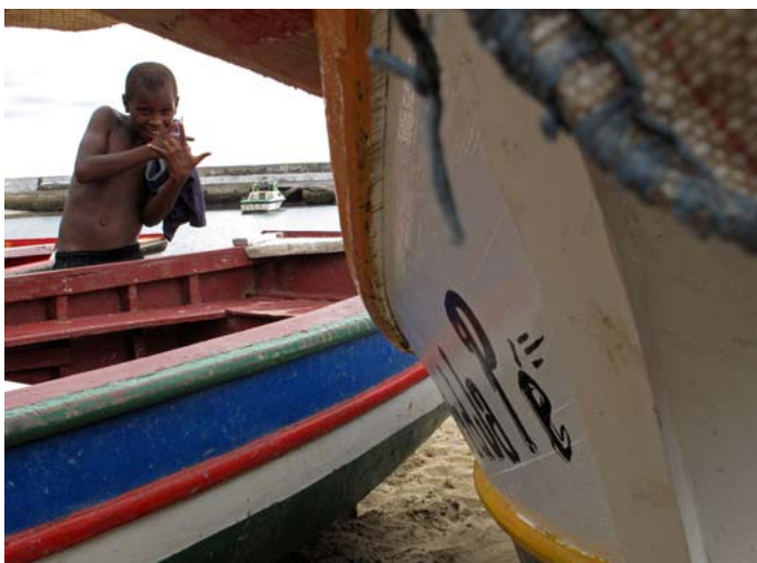
Port de pêche Tarrafal de Santiago

Les projets de l'association Regarde ailleurs pour les années à venir devraient continuer dans les mêmes orientations que ces 2 dernières années ; à savoir le soutien en terme d'aide alimentaire. L'association compte travailler avec des pêcheurs pour développer un partenariat triparti (association, pêcheur, délégation scolaire). L'idée que nous avons depuis plusieurs années est d'acquérir un petit bateau de pêche et de le mettre à disposition de pêcheurs. La contre partie de ce financement matériel serait une distribution d'un certain pourcentage de poisson rétrocédé aux écoles. Ce projet est en cours de discussion. Nous comptons également renforcer la présence de l'association sur place afin de suivre les projets au plus proche.