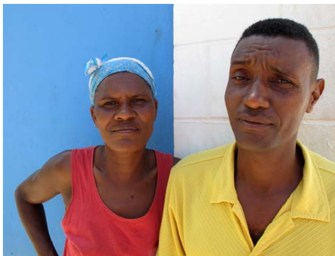
Vendeuse de poissons séchés // Responsable des cantines de la zone de Porto Novo

Pour obtenir des informations sur la vie de l'association consultez notre site internet http://regarde.ailleurs.free.fr