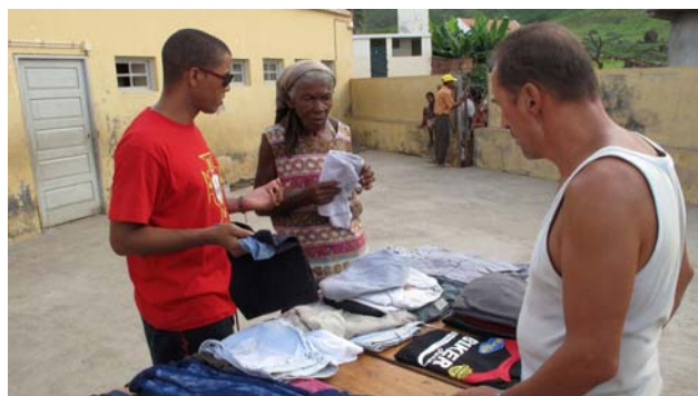
Distribution de vêtements à Estancias Bras