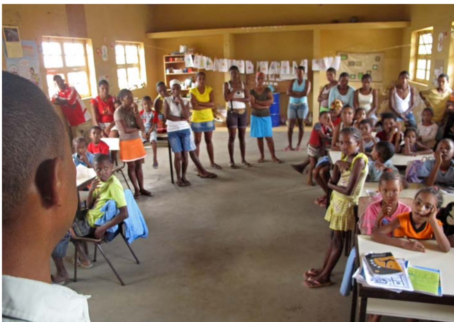
Présentation des projets d'aide en présence des parents, élèves & professeurs

Frais de fonctionnement 4,36 % des dépenses totales