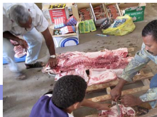
Découpe des porcs pour la congélation