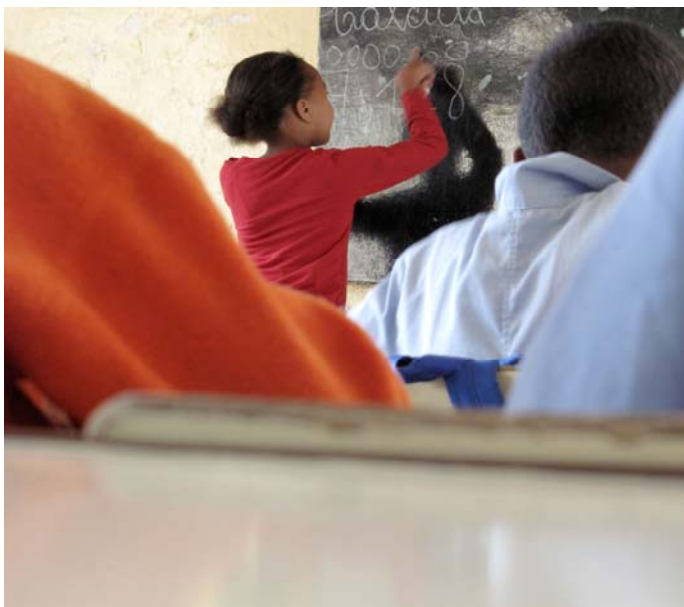
A l'école de Covoada // São Nicolau

la société Original , le comité des fêtes de Châteaudouble, la mairie de Châteaudouble, le conseil général du département de la Drôme, le comité d'entreprise de la société Imaje, les visiteurs des expositions photographiques, les adhérents, les donateurs, les acheteurs de supports photographiques, toutes les capverdiennes et tous les capverdiens.