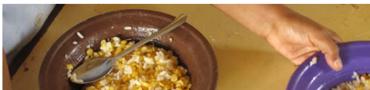
Repas à la cantine scolaire // Juncalinho - São Nicolau