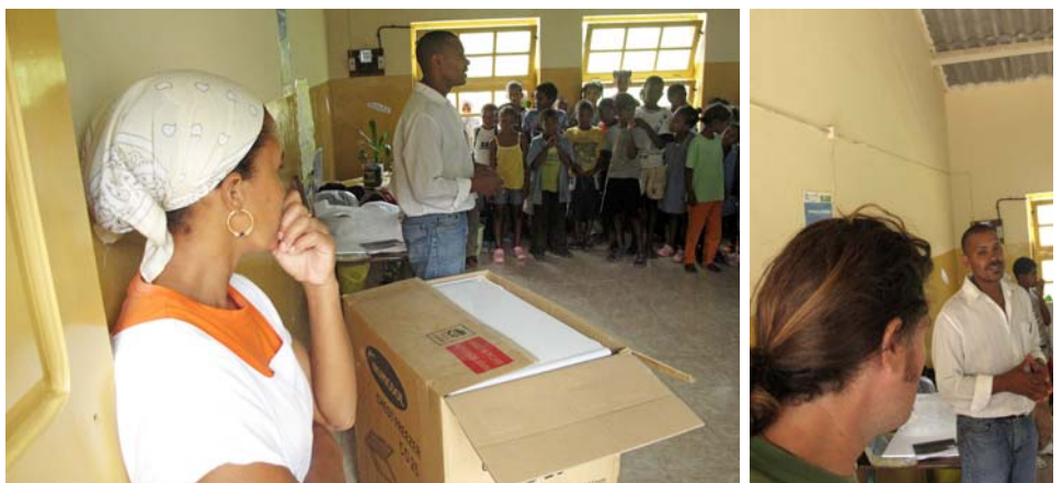
Présentation du projet aux écoles par la délégation scolaire et Regarde ailleurs

Les 5 écoles ont reçu chacune leur congélateur en présence d'un responsable du ministère de l'éducation, un membre de l'association Regarde ailleurs, des professeurs, des élèves, des parents et des cantinières.