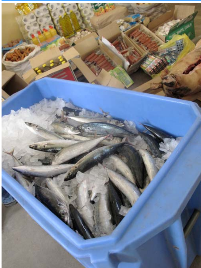
Stock de nourriture // Vila Ribeira Brava - São Nicolau

L'association continue à suivre sa politique en concentrant ses actions sur les îles rurales de São Nicolau et de Santo Antão. L'association Regarde ailleurs prévoit également d'étendre ses actions de soutien sur les îles du sud du Cap Vert.