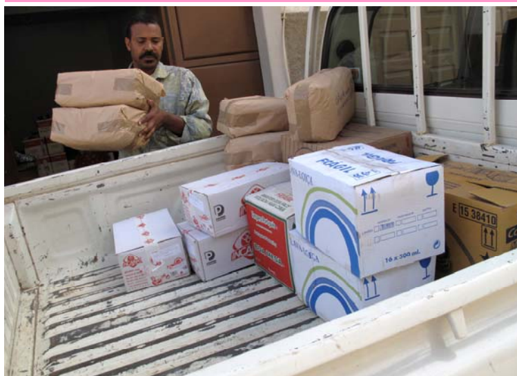
Achat de nourriture // Vila Ribeira Brava - São Nicolau

Le poisson a également pu être stocké dans le congélateur du magasin général qui a été financé par l'association . L'association a également complété l'achat de poisson par l'achat de porcs vivants (qui ont ensuite été tués, découpés puis congelés). En effet, avec la délégation scolaire de São Nicolau nous avons initialisé un projet de financement de congélateurs dans les écoles et à la délégation scolaire. L'idée est de donner la possibilité aux écoles d'acheter du poisson lorsque le prix est le plus faible et de le stocker dans le congélateur. Uniquement les écoles ayant l'électricité seront éligibles à ce projet.