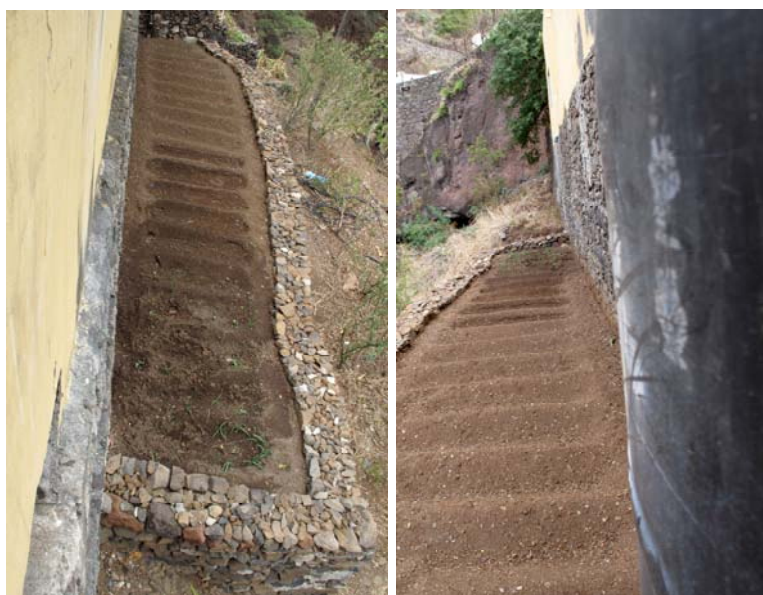
Jardin scolaire avec système d'irrigation // Fontainhas - Sto Antão

Lors de la visite de l'école de Fontainhas l'association a pu constater le bon déroulement du projet de jardin scolaire initialisé en 2008. Celui-ci va permettre d'apporter un complément nutritionnel à la cantine de façon régulière. De plus, les élèves apporteront leur contribution au développement de ce jardin.