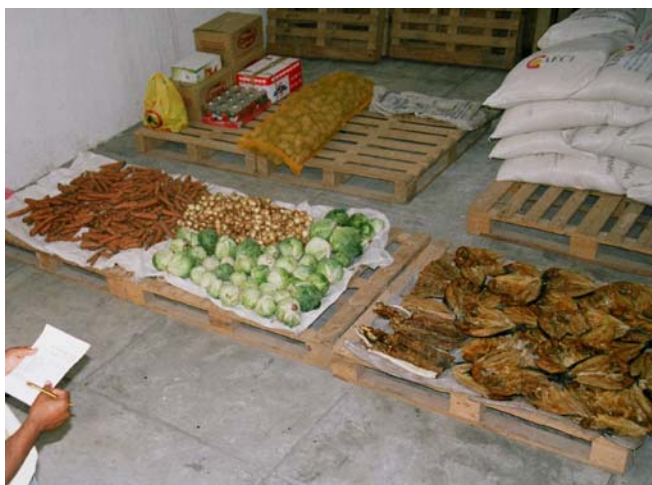
Stock en produit frais livré dans le magasin central de Ribeira Grande