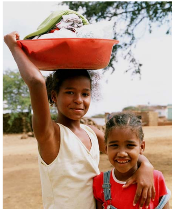
Fillettes de Juncalinho // île de São Nicolau

Pour obtenir des informations sur la vie de l'association consultez notre site internet http://regarde.ailleurs.free.fr