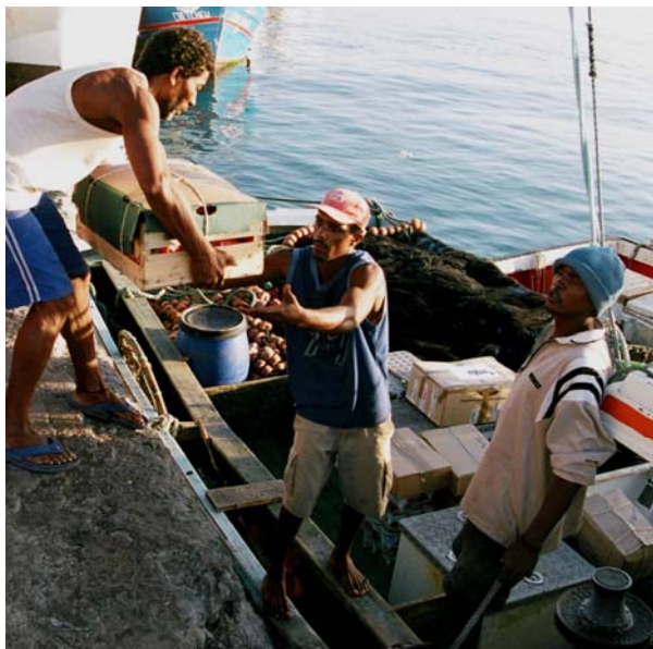
Chargement du bateau à Mindelo pour Monté Trigo