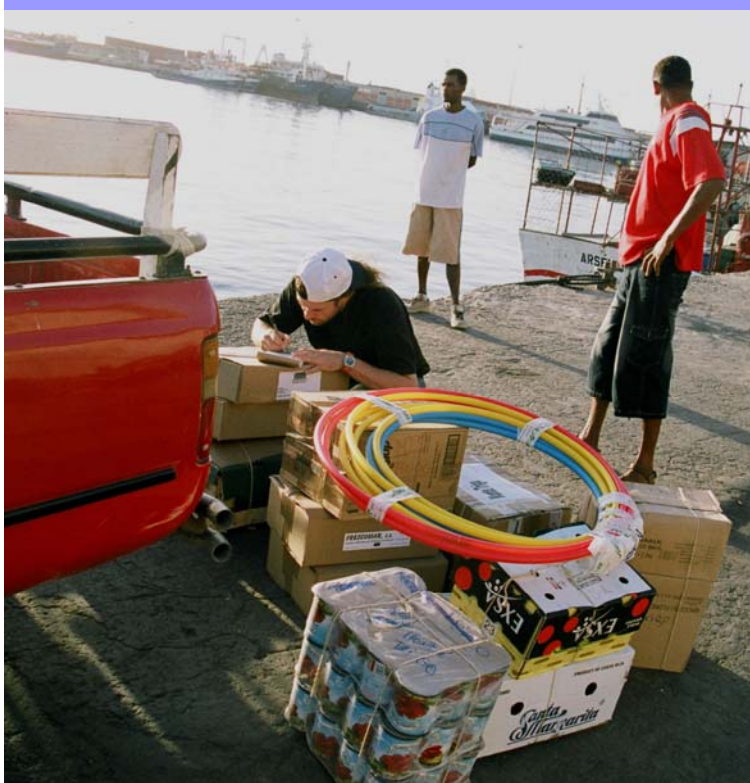
Signature du reçu des marchandises pour le transport maritime

En fin de stock, le responsable fournira toutes les fiches de sortie des denrées en guise de justificatifs de livraison.