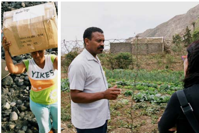
Livraison Monté Trigo // Jardin scolaire Belem

L'association concentre toujours ses actions sur les îles rurales de São Nicolau et de Santo Antão et élargit son périmètre d'actions en passant de 9 écoles soutenues en 2007 à 12 en 2008 . Sur ces 12 écoles, 8 ont reçu une aide en denrées alimentaires et 7 une aide en matériel scolaire et pédagogique. Les membres de l'association ont également effectué une médiation entre un propriétaire terrien et une école. Ils sont ainsi parvenus à obtenir une parcelle de terre pour réaliser un jardin potager dans une zone où la terre est rare. Le potager devrait produire ses premiers légumes dès la rentrée 2008/2009.